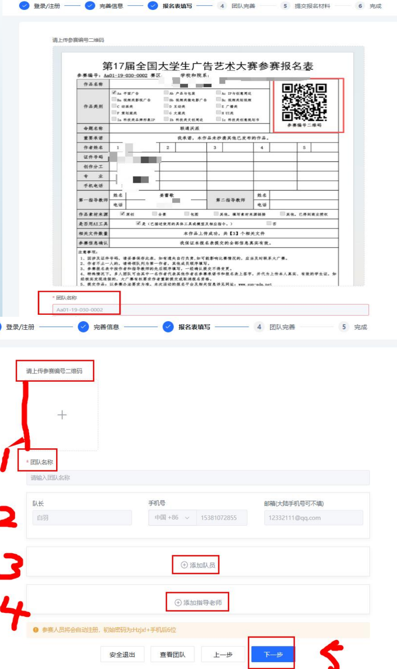
图5 队长填写参赛报名团队信息