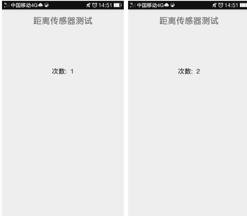
图× App 计数运行的界面