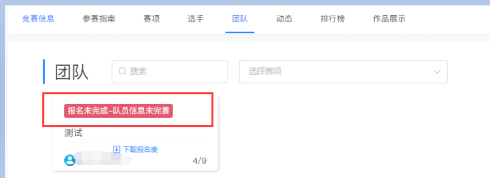
图8 队员信息未完善状态