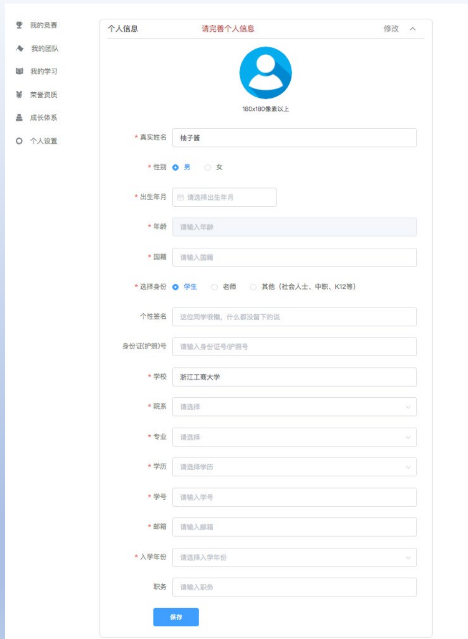
图6 队长完善个人信息页面