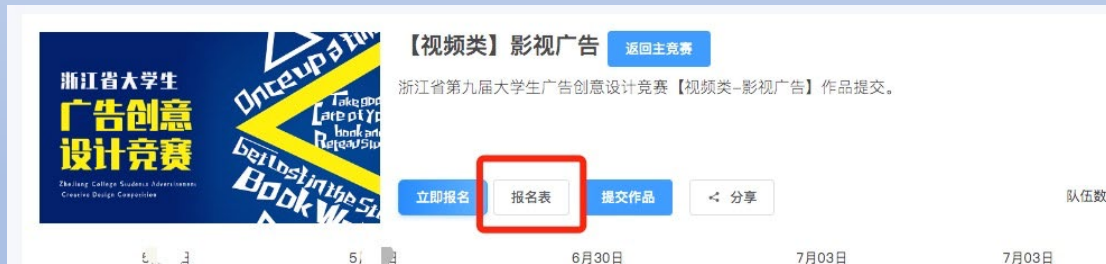
图14 进入报名表页面